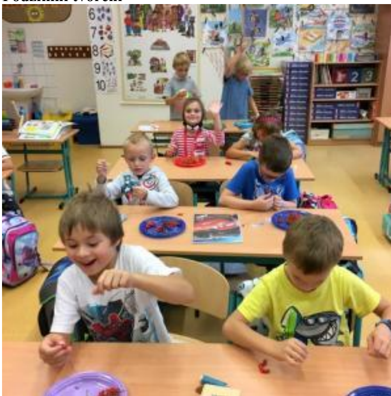
Pohádka Perníková chaloupka – 1. A